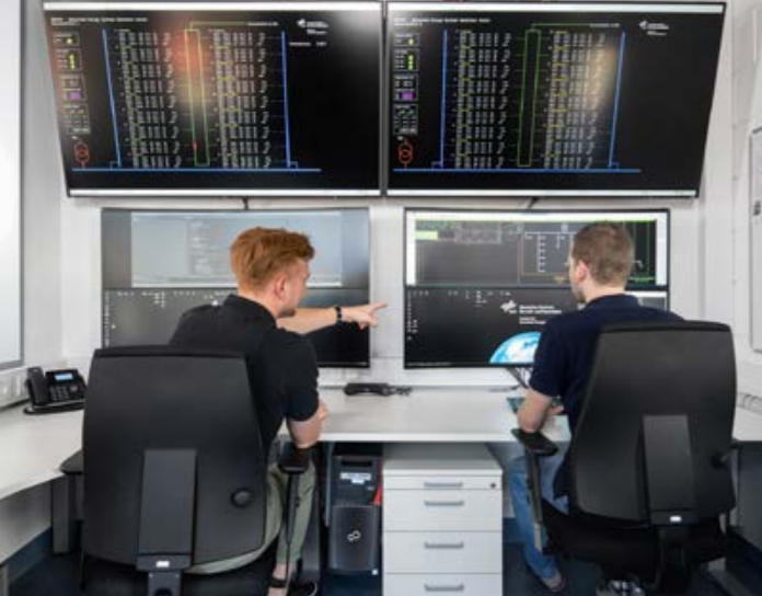
Im Emulationszentrum NESTEC des DLR-Instituts für Vernetzte Energiesysteme lassen sich komplexe Stromnetze realitätsnah nachbilden.