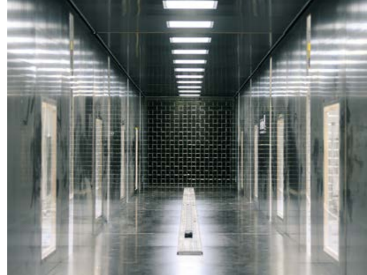
Der 30 Meter lange Windkanal mit seinem 9 Quadratmeter großen aktiven Gitter ist das wissenschaftliche Herzstück des Oldenburger WindLabs.

verwenden. Davon abgesehen war das Energielabor autark. „Alle Technologien, über die wir aktuell diskutieren, gab es damals schon“, sagt Köritz.