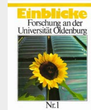
Bereits fünf Mal war Energieforschung das EINBLICKE-Titelthema. Das Titelbild der ersten Ausgabe im April 1985 zeigt die Warmwasserkollektoren an der Außenwand des Energielabors.

2017, als NEXT ENERGY eine neue Heimat unter dem Dach des Deutschen Zentrums für Luft- und Raumfahrt (DLR) fand, steckte die Photovoltaikindustrie in der Krise, und es wurde klar, dass die wichtigste Aufgabe in Zukunft darin liegen würde, die erneuerbaren Quellen mit ihren schwankenden Erträgen gut ins Energiesystem zu integrieren. „Wir sind daher ein reines Systemforschungsinstitut geworden“, sagt Agert. Zehn Forschungsgruppen befassen sich heute etwa mit dem Energiemanagement in intelligenten Stromnetzen („Smart Grids“), der Kopplung der Energiesektoren oder der Modellierung der zukünftigen Energieversorgung.