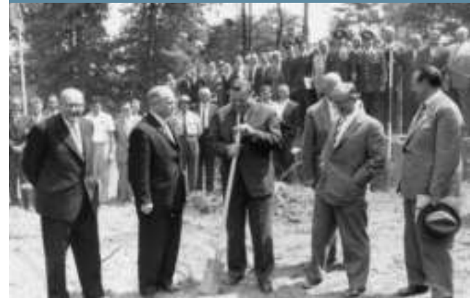
Der erste Spatenstich auf dem DVL-Gelände in Porz-Wahn 1959 durch Verteidigungsminister Franz Josef Strauß