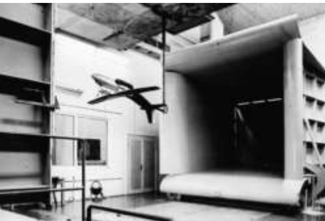
Modell einer Transall im Windkanal 1965