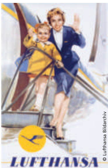
Plakatmotiv der Lufthansa aus den 50er-Jahren