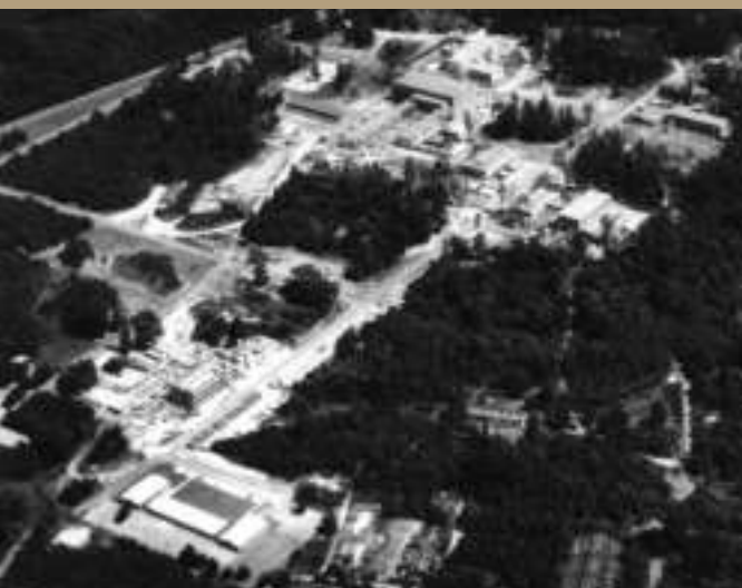
Luftaufnahme der Deutschen Versuchsanstalt für Luftfahrt (DVL) in Köln-Porz 1965

Im Jahr 1950 wurde die Köln-Bonner Flughafen Wahn GmbH gegründet und dieser die Nutzung der Einrichtungen des Flughafens Wahn für ein Jahr erlaubt. Träger der Einrichtung waren die Bundesrepublik, das Land Nordrhein-Westfalen, die Städte Köln, Bonn, Porz sowie der Siegkreis und der Rheinisch-Bergische Kreis. Der kommerzielle Flugbetrieb konnte beginnen – wenn auch nicht mit deutschen Fluggesellschaften. Der Ausbau ging nun zügig voran, schon 1954 verfügte der Flughafen Köln-Bonn mit der 2,5 Kilometer langen Querwindbahn über die längste Startbahn in der Bundesrepublik.