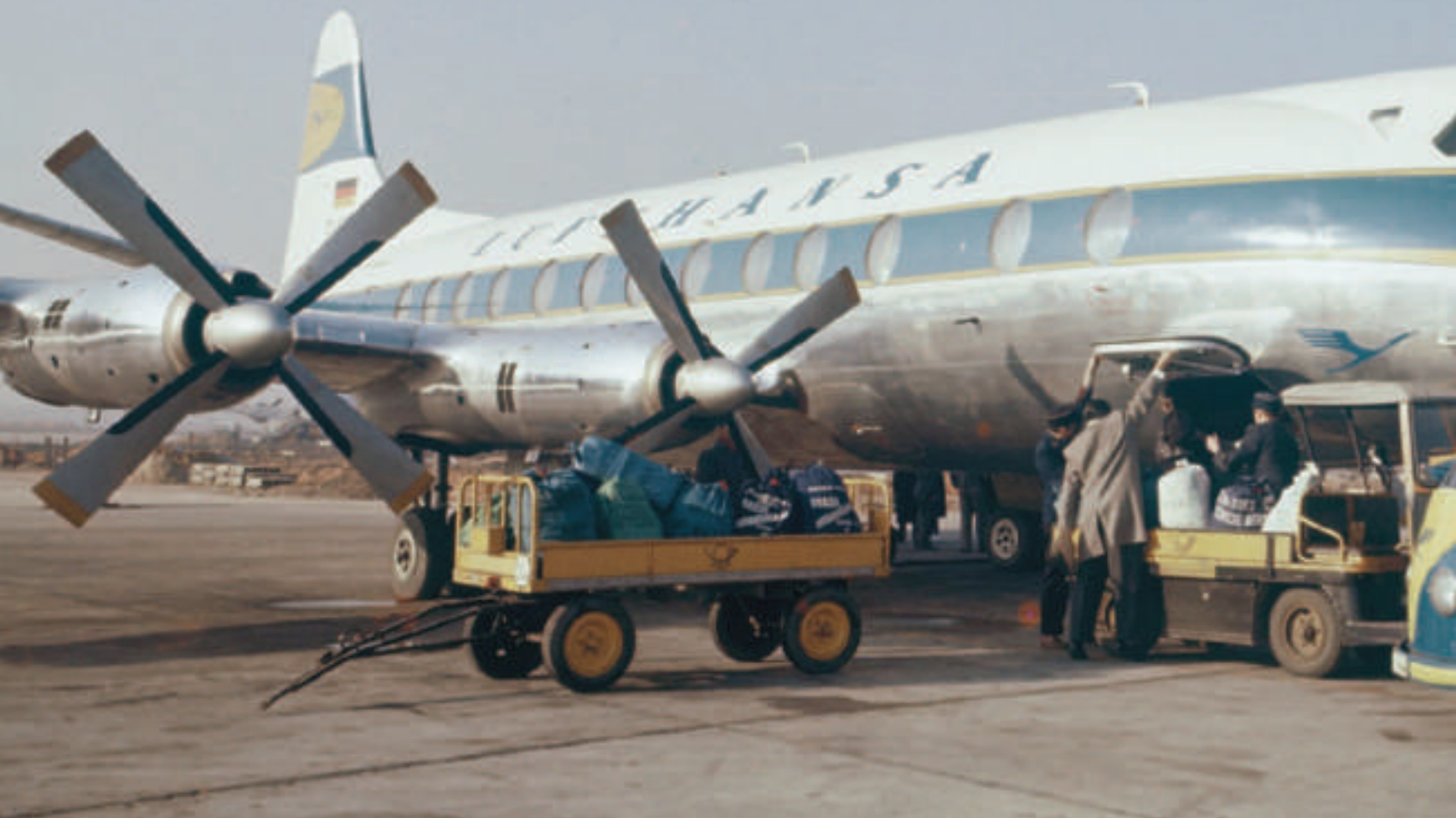
Vickers V814 „Viscount“ der Lufthansa, von 1958 bis 1971 im Einsatz