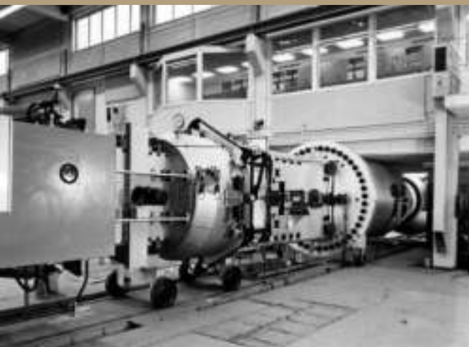
Messstrecke des Überschallkanals in Porz-Wahn 1965