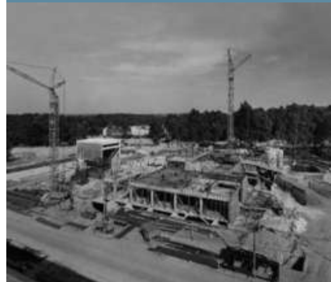
Bau des Instituts für angewandte Gasdynamik 1962

ierten im Ausland. Nur wenige Arbeitsgruppen waren bereits vor Kriegsende mitsamt ihren Geräten nach Süddeutschland umgezogen.