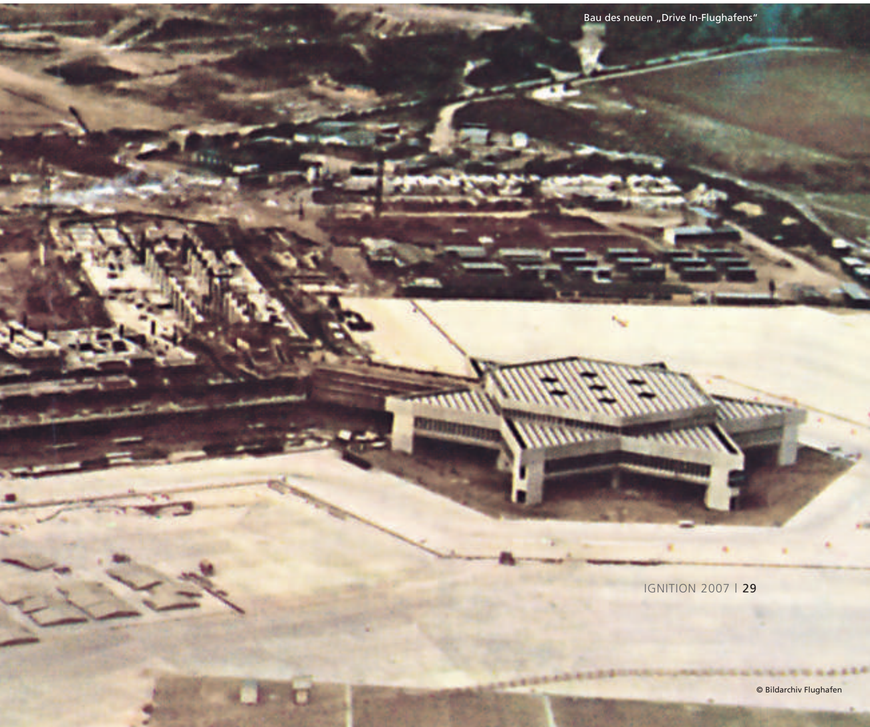
Bau des neuen „Drive In-Flughafens“

Es hat seinen guten Grund, dass der Tag der Luft- und Raumfahrt zwei Aspekte im Titel vereint: Neben dem Deutschen Zentrum für Luft- und Raumfahrt (DLR) mit seinen Instituten und dem angeschlossenen 1994 gebauten Europäischen Transsonischen Windkanal (ETW) beteiligen sich seit 2004 auch der Flughafen Köln-Bonn und die benachbarte Luftwaffe an der Veranstaltung. So gelangt der Besucher des DLR an diesem Tag durch ein kleines Wäldchen zum Static Display auf dem Flughafengelände, wo nicht nur der „Parabelflieger“, sondern auch verschiedene Flugzeuge der Luftwaffe besichtigt werden können. Das Campus-Gelände erweist sich als weitläufig und vielfältig, auf dem ca. 35 Hektar großen DLR-Gelände sind neben der Hauptverwaltung und Windkanälen auch Einrichtungen zur Erforschung von Antrieben, Solartechnik und zur Weltraumsimulation zu besichtigen. Auf dem Flughafengelände arbeiten heute fast 11.000 Menschen, etwa 2.000 davon bei der Flughafengesellschaft; das DLR beschäftigt an seinem Standort in Köln-Porz circa 1.500 Mitarbeiter. Diese Ausmaße im Kölner Raum vorzufinden lässt einen zunächst staunen, war doch die Luftfahrtforschung und -industrie von je her in Süd- und in Norddeutschland angesiedelt, nicht in Nordrhein-Westfalen. Wie ist dieser heute renommierte Luftfahrt- und Forschungsstandort entstanden?