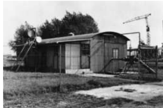
Gebäude der DVL am Flugplatz Essen-Mühlheim 1955