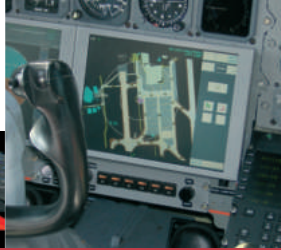
Eingebautes Display im ATTAS-Cockpit

Selbst nach einer automatischen Landung bei ungünstigen Wetterbedingungen werden Rollbewegungen am Boden heute von der Cockpitbesatzung fast immer noch ausschließlich nach Sicht und Papierkarte durchgeführt. Die Fluglotsen der Vorfeldkontrolle sind ihrerseits stark auf den visuellen Sichtkontakt mit den Luftfahrzeugen angewiesen, die Kommunikation zwischen Lotsen und Piloten findet ausschließlich über Sprechfunk statt.