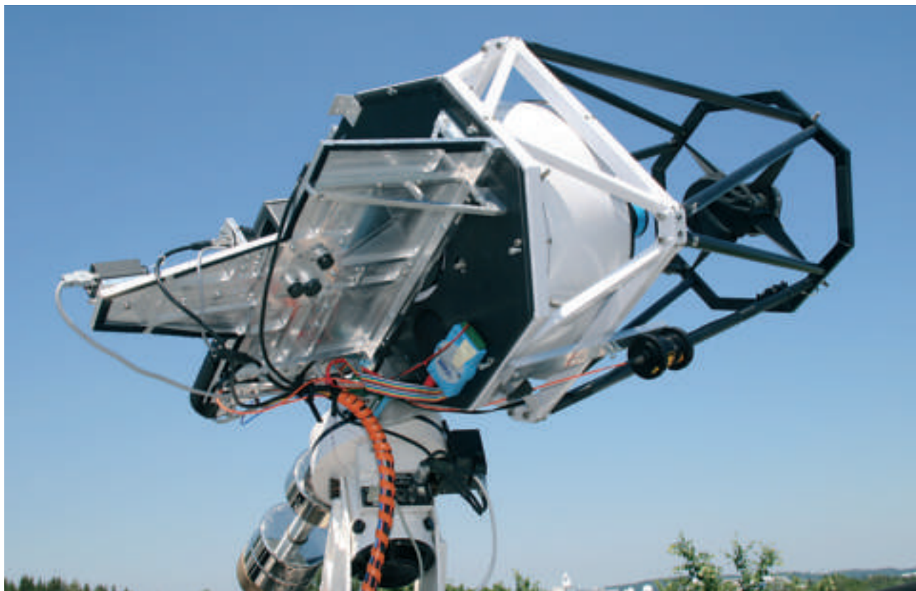
Das KIODO-Empfangsterminal – ein 40 Zentimeter Cassegrain-Teleskop mit fokalen Messgeräten und optischem Receiver-Frontend – in der optischen Bodenstation Oberpfaffenhofen