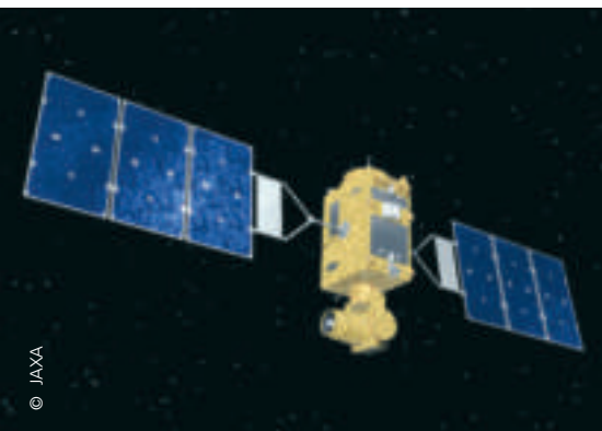
OICETS in-orbit mit dem optischen Terminal „LUCE“ nach unten gewandt

z. B. auf Bergen oder in südlichen Regionen. Die Stationen können sich dann beim Empfang je nach Bewölkungslage abwechseln. Da die optischen Empfangsstationen kostengünstiger sind als große Funk-Antennen und außerdem fernbedient betrieben