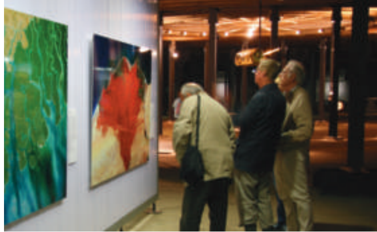
„Das Auge des Himmels“ zog bereits in der ersten Ausstellungswoche 5.000 Besucher in seinen Bann Seite 4