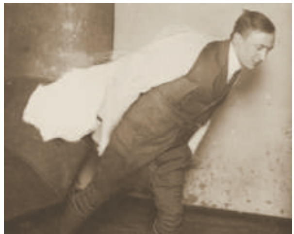
Windkanäle zählen bis heute zum unentbehrlichen Forschungsinstrumentarium – und bis heute muss man sich etwas einfallen lassen, um ihre Funktions- weise anschaulich darzustellen Seite 44