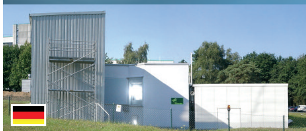
10-kW-Sonnenofenversuchsanlage auf dem DLR-Gelände in Köln-Porz.