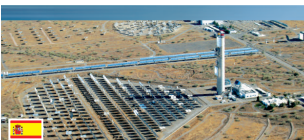
Luftaufnahme des spanischen Testzentrums Plataforma Solar de Almería.