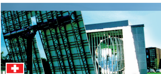
40-kW-Sonnenofenversuchsanlage am Paul Scherrer Institut in Villigen in der Schweiz (Quelle: PSI).