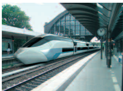
NGT – der Zug der Zukunft NGT – the train of the future

In den letzten zehn Jahren haben sich die Anforderungen an Schienenfahrzeuge massiv gewandelt. Angetrieben wird diese Entwicklung von