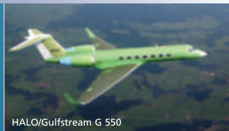
HALO/Gulfstream G 550