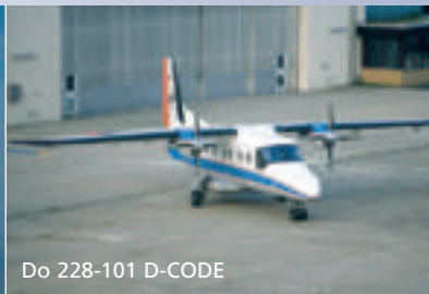
Do 228-101 D-CODE