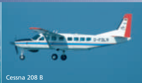
Cessna 208 B