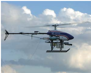
ARTIS - Autonomous Rotorcraft Testbed for Intelligent Systems