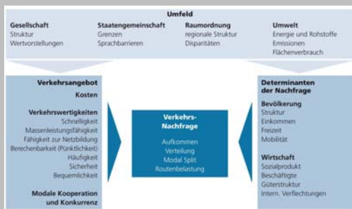
Zusammenhänge im Verkehr