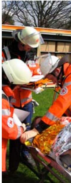
Papier-basierte Registrierung bei einer Übung

Auf der einen Seite brauchen Einsatzleitung und Rettungskräfte schnellstmöglich Informationen über Art und Anzahl von Verletzungen. Auf der anderen Seite muss auch der Weg der Betroffenen speziell bei Kontaminationsszenarien durch die verschiedenen Stationen der Rettungskette nachverfolgbar sein bzw. soll einfach der Verbleib von Personen dokumentiert sein, so dass Angehörige entsprechend informiert werden können.