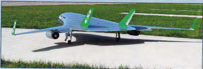
Der Nurflügler AC20.30 wird seit Mai 2011 erprobt.

Die Hochschule für Angewandte Wissenschaften Hamburg (HAW) arbeitet seit dem Jahr 2000 in Kooperation mit der TU München im Forschungsprojekt „Blended Wing Body AC20.30“ am Nurflügel-Konzept. Das erste flugfähige Modell, das über zwei Zweiblattpropeller und ein Modellbau-Steuerungssystem gesteuert werden konnte, wurde 2004 entwickelt. Anfang Mai 2011 testete