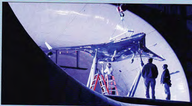
Im Windkanal zeigte die X-48B viel versprechende Eigenschaften.

Seit einigen Jahren arbeiten die Boeing Phantom Works, die Nasa und das Air Force Research Laboratory zu-