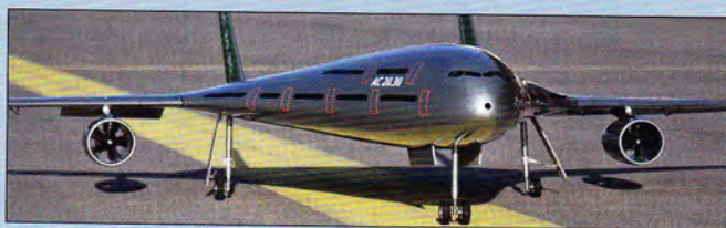
Modell des BWB AC20.30 der HAW Hamburg.