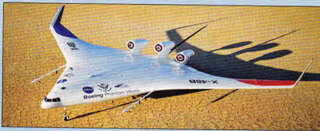
Zwei Modelle der Boeing X-48B werden im Flug untersucht.