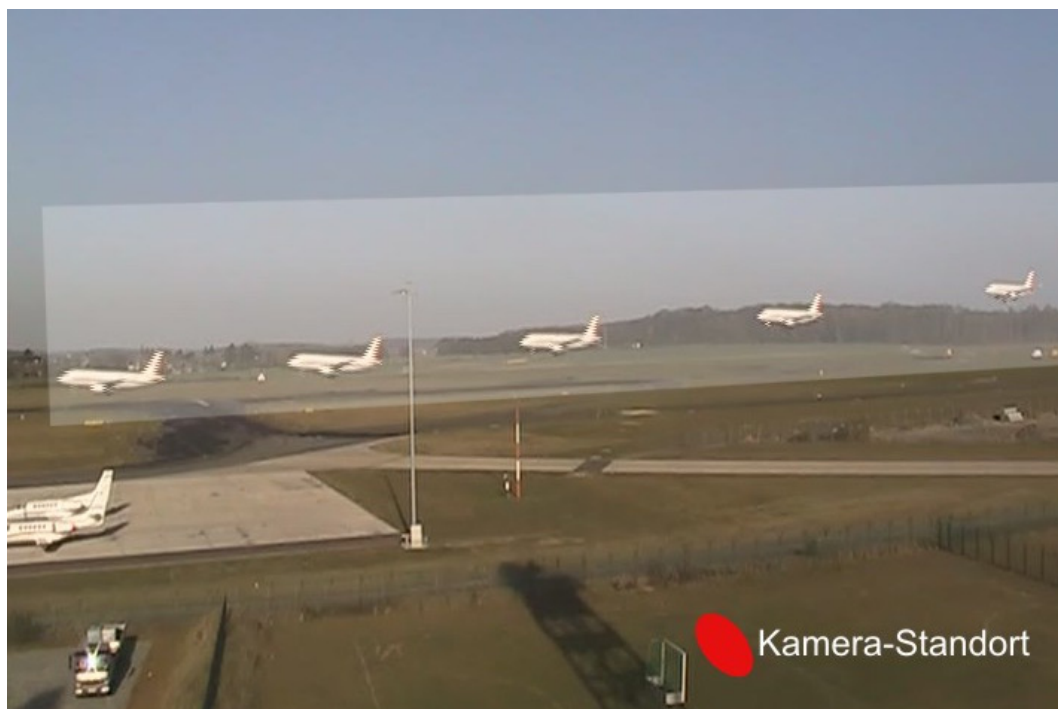
Abb. 3: Landeanflug des DLR-Forschungsflugzeugs ATRA auf dem Flughafen Braunschweig als Sequenz aus Einzelbildern. Ein geeigneter Standort für die Kamera (roter Punkt) ist so gewählt, dass der gesamte Landevorgang in einer Ebene senkrecht zur Kamerablickrichtung abläuft.

Wichtig: Während der Aufnahme selbst sollten Kamerabewegungen wie „Wackler“ oder auch Schwenks unbedingt vermieden werden. Stell daher die Kamera mit einem Stativ auf einen festen Untergrund.