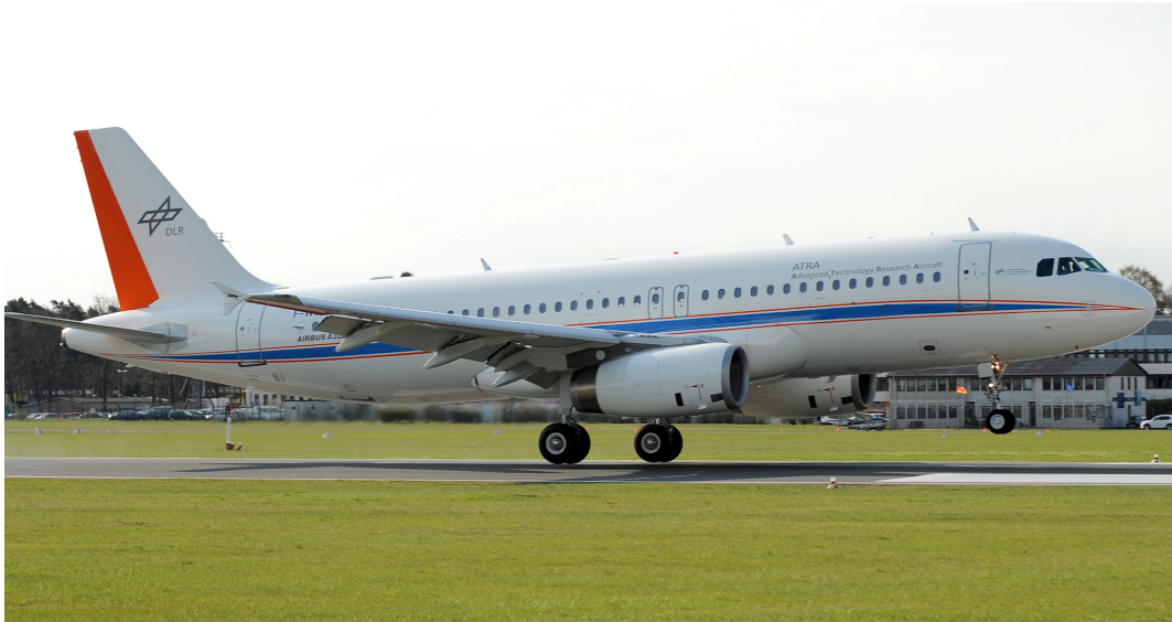
Abb. 1: Starts und Landungen von Flugzeugen sind längst ein alltägliches Bild. Die Physik dahinter lässt sich leicht graphisch anhand eines selbst gedrehten Videos ermitteln.