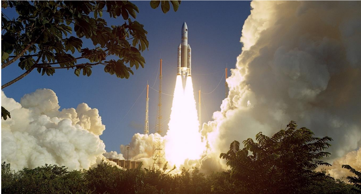
Abb. 1: In den Nachrichten sind Starts von Raketen für die Zuschauerinnen und Zuschauer schon etwas fast Selbstverständliches. Auch ist uns allen klar, dass ohne Raketen, die Satelliten ins All transportieren, keine Wetterbeobachtung, kein Satellitenfernsehen, keine weltumspannende Telekommunikation und kein GPS möglich wären. Doch warum heben Raketen überhaupt vom Erdboden ab und wie können sie sich im Vakuum des Weltalls bewegen? Mit einer einfachen, selbst gebauten Wasserrakete könnt ihr dem Antrieb von Raketen auf die Spur kommen.