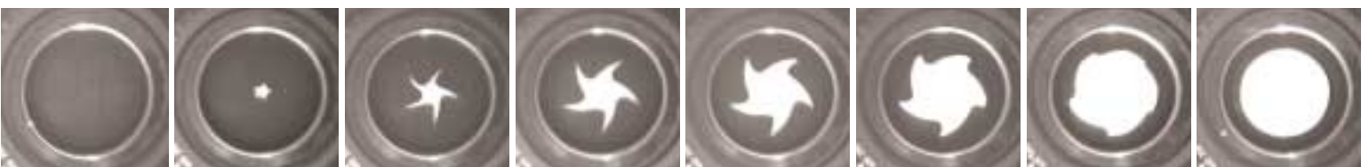
Unten: Öffnung eines mechanischen Kameraverschlusses

Es galt ein Aufnahmesystem zu entwickeln, das sich mit ultrakurzen Vorgängen synchronisieren lässt. Am Institut für Aerodynamik und Strömungstechnik des DLR in Göttingen wurde mit der UHSV-288 ein solches Wunderwerk gebaut.