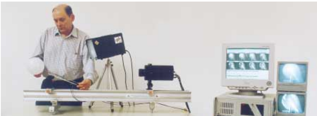
Der komplette Versuchsaufbau

Die Bilder werden in einem achtkanaligen Bildspeicher, dem so genannten Framegrabber eines Rechners, gespeichert und stehen dann als Pixel-Grafikdateien im TIFF- oder BMP-Format zur weiteren Auswertung zur Verfügung.