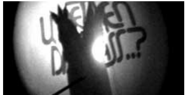
Wetten, dass man genau beobachten kann, wie ein Luftballon platzt?