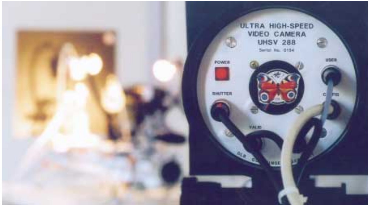
Rechts und unten: Die Ultra High Speed Video Kamera.