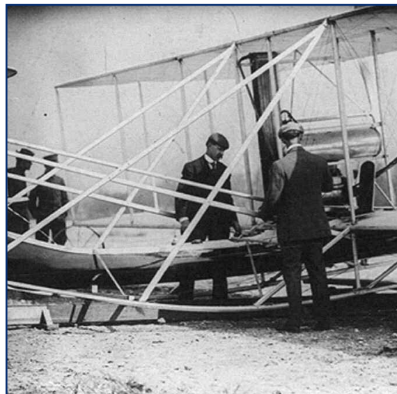
Den Gebrüder Wright gelang es 1903 zum ersten Mal, mit einem motorgetriebenen Flugzeug zu fliegen.

Auch Leonardo da Vinci hat noch angenommen, dass Vogelflug für Menschen möglich sei. Heute wissen wir, dass der Schwingenflug für den Menschen nicht zu verwirklichen ist, da seine Muskelkraft für die Überwindung der Schwerkraft viel zu gering ist. Erst die Erfindung des Verbrennungsmotors lieferte die dafür nötige Leistung.