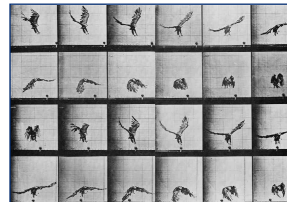
Flugphasen eines Adlers

Wie fliegt ein Vogel? Man könnte denken, diese Frage sei leicht zu beantworten: „Er schlägt einfach mit den Flügeln auf und ab. Oder?“ Dass dies durchaus nicht so einfach ist und Dädalus und Ikarus mit ihren Schwingen schon (Luft-)Schiffbruch erlitten hätten, noch bevor sie der Sonne zu nahe gekommen wären, lässt sich mit dem Vogelmodell des ANIPROP untersuchen. Bei dem hier simulierten Schwingenflug führt tatsächlich erst eine geeignete Kombination von Schlägen und Drehen der Flügel zum gewünschten Vortrieb, der bei Flugzeugen durch die Motoren gewährleistet wird.