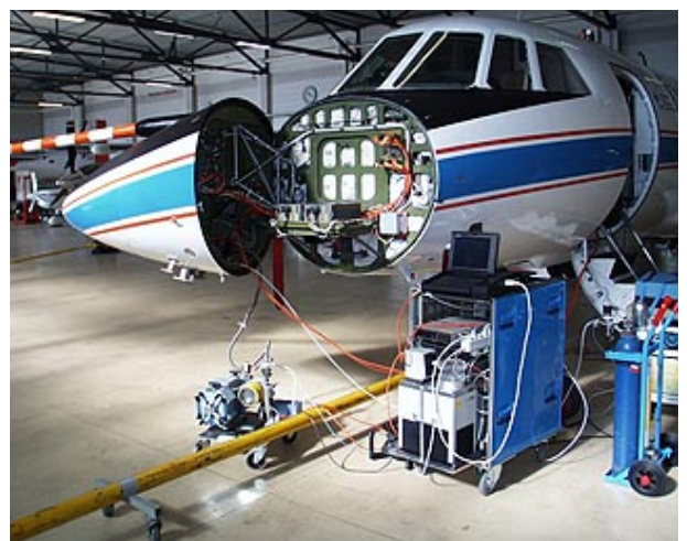
Die Falcon mit geöffnetem Rumpf

Dem DLR steht am Standort Oberpfaffenhofen das Forschungsflugzeug Falcon zur Verfügung, das mit einer Reihe von Basissensoren ausgestattet ist. Die langjährige Erfahrung des Flugbetriebes Oberpfaffenhofen sowie die Möglichkeit auf eine große Anzahl von Spezialflügen und Manöver zurückzugreifen stehen für eine garantiert hohe Qualität der ausgelieferten Daten.