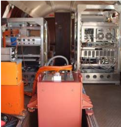
Windlidarsystem installiert im DLR Forschungsflugzeug Falcon.