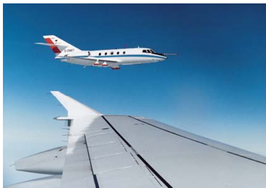
Oben: Darstellung der Luftströmung um eine Tragfläche, unten: DLR Forschungsflugzeug Falcon