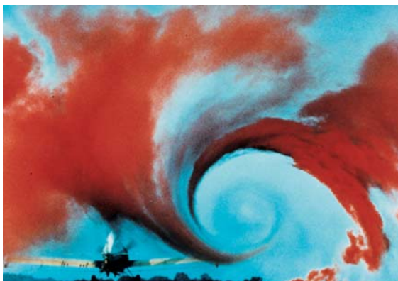
Wirbelschleppe eines startenden Flugzeuges

Im Rahmen des EU Projekts AWIATOR wurde der Nachweis erbracht, dass es möglich ist die Wirbelschleppen hinter einem Flugzeug aus der Luft von einem anderen Flugzeug aus mit Hilfe eines Lidars zu erfassen und zu charakterisieren. Bei dem Versuch wurden die Wirbelschleppen von dem DLR-Testflugzeug ATTAS in 2000 m Höhe erzeugt und mit dem ca. 900 m darüber fliegenden DLR-Forschungsflugzeug Falcon vermessen. Mittels eines an der linken Flügelspitze des ATTAS angebrachten Rauchgenerators wurde das Rückstreusignal verstärkt, da es sich beim ATTAS um ein relativ kleines Flugzeug mit entsprechend schwacher Wirbelschleppe handelt. Bislang war nur die Detektion bodennaher Wirbelschleppen möglich. Die luftgetragene Messmethode ermöglicht nun auch die Vermessung von Wirbelschleppen, die sich oberhalb der atmosphärischen Grenzschicht befinden.