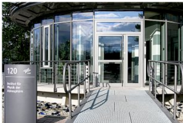
Das Institut für Physik der Atmosphäre

Dadurch bietet sich die Möglichkeiten zur Bestimmung der chemischen Zusammensetzung der Atmosphäre aber auch zur Geschwindigkeitsmessung von bewegten Objekten.