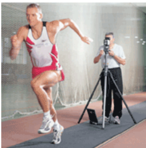
Geschwindigkeitsmessung mit LIDAR

Des Weiteren besteht die Möglichkeit, mithilfe moderner Messinstrumente selbstständig eigene Messungen durchzuführen.