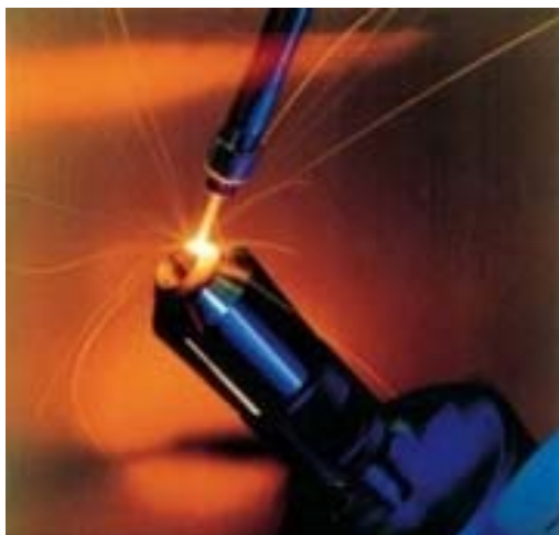
Lasertechnik ist Präzisionsarbeit