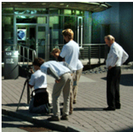
Eine Schülergruppe bei der Arbeit

Um solche Messungen überhaupt durchführen zu können, benötigt man aber ein gewisses Grundverständnis für die Funktionsweise eines Lasers. Anfang des 20. Jahrhunderts legte Albert Einstein die theoretische Grundlage durch seine Beschreibung des Phänomens der „stimulierten Emission von Strahlung“, bei der man Elektronen in einen angeregten Zustand bringt, dort sammelt und dann kontrolliert in den Grundzustand übergehen lässt.