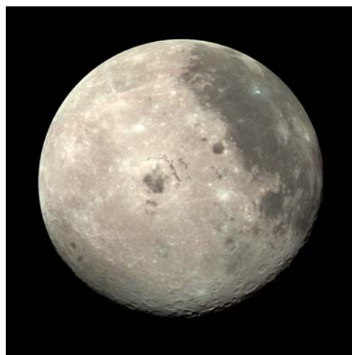
Die Rückseite des Mondes - für uns sichtbar gemacht von der Raumfähre Galileo.