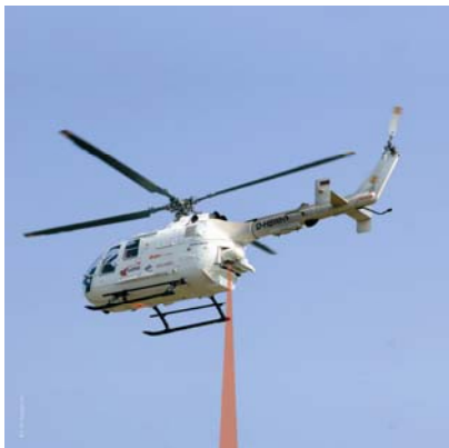
CHARM®-Hubschrauber der E.ON Ruhrgas AG

Auf dem diesjährigen „Tag der Luft und Raumfahrt“ am Sonntag, dem 20. September 2009, in Köln-Porz haben Sie die Gelegenheit, zukunftsweisende DLR-Technologien für industrielle Anwendungen zu entdecken. Auf über 500 m 2 Fläche präsentiert das DLR-Technologiemarketing unter dem Motto "DLR-Innovationen – Ihr Erfolg mit unseren Technologien" innovative High-Tech-Lösungen für den Markt. Darüber hinaus stellen sich erfolgreiche Ausgründungen aus dem DLR sowie strategische Innovationspartner des DLR-Technologiemarketings vor.