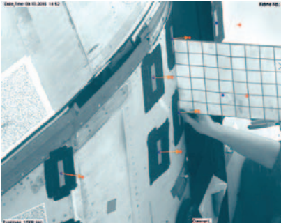
Bild 1: Kalibrationsbild mit Referenzposition (blau) und gemessener Position (rot).