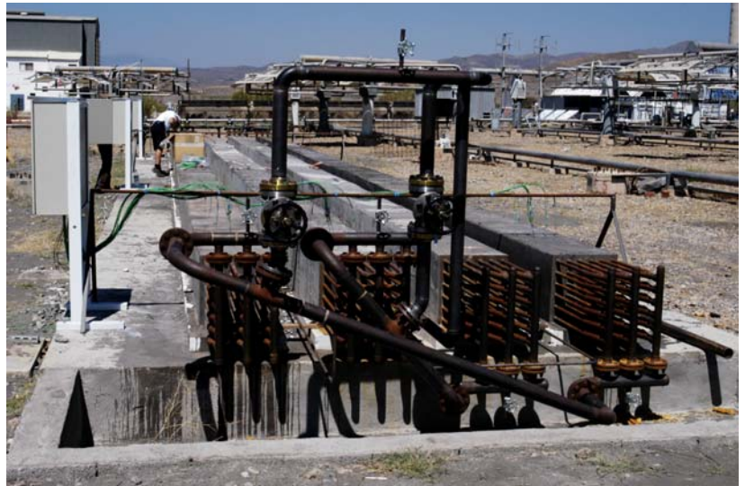
Feststoffspeicher mit einer Gesamtkapazität von 700 kWh: Zwei Module mit Gießkeramik und zwei Module mit Hochtemperatur-Beton

* gefördert vom BMU im Rahmen des ZIP Programms