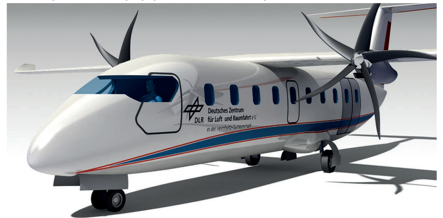
Ansicht eines vom DLR geplanten nationalen Erprobungsträgers für elektrisches Fliegen. Mit ihm sollen Flüge eines elektrifizierten Passagierflugzeugs für den kommerziellen Luftverkehr durchgeführt werden.

Das ist ambitioniert, aber für Kurzstreckenflugzeuge durchaus realistisch. Heute schaffen wir es bereits, zwei bis vier Personen über mehrere hundert Kilometer elektrisch zu transportieren. Mit unserer Brennstoffzellenforschung denken wir an Reichweiten bis zu 1.500 Kilometer. Damit ließe sich Norwegen schon fast ganz überfliegen. Die meisten Strecken dort sind aber deutlich kürzer, häufig um die 500 Kilometer. Die Herausforderung liegt in der Skalierung auf