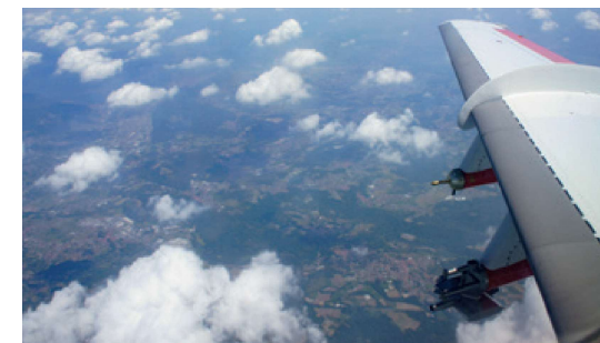
Messungen in den Wolken der Po-Ebene

Entwicklung des troposphärischen Stickstoffdioxids von 2016 bis 2020, gemessen mit dem GOME-2-Sensor an Bord der europäischen Wettersatelliten MetOp. Die Werte von März bis April 2020 sind im Vergleich zu denen der Vorjahre deutlich reduziert, während die Werte im Mai 2020 nach Aufhebung der Lockdown-Maßnahmen wieder angestiegen sind.