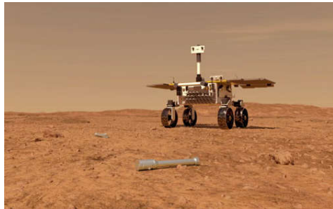
Der Fetch-Rover, der 2026 zum Mars starten könnte, sammelt die Proben ein und transportiert diese zum Mars Ascent Vehicle (MAV)