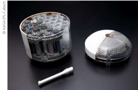
Magazin mit Probenkapseln für den Rover Perseverance

Hauber: Es gibt internationale Gruppen von Forscherinnen und Forschern, die diese Ideen entwickeln und vorschlagen. Seit Sommer 2020 arbeite ich in der von NASA und ESA initiierten Mars-Sample-