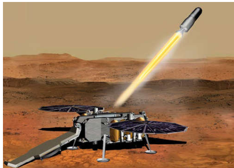
Das MAV befördert die Probenkapseln in einen Orbit um den Mars, wo sie von einer Raumsonde eingesammelt und zur Erde gebracht werden