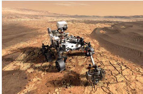
Der Rover Perseverance der Mars-2020-Mission nimmt mit seinem Arm Proben des Marsgesteins und legt diese versiegelt auf dem Boden ab

Schmitz: Die Analysetechniken auf Rovern sind in Größe und Komplexität begrenzt. Da ist es hilfreich, ein umfangreicheres Arsenal an Analysemethoden auf der Erde zur Verfügung zu haben. Manche Geräte aus diesen Laboren lassen sich noch nicht für einen Raumflug verkleinern. Zudem ist es ein großer Vorteil, heute Proben einzusammeln, die auch noch in Jahrzehnten auf der Erde mit weiterentwickelten Techniken untersucht werden können.