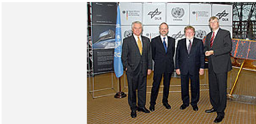
Einweihung des UN-SPIDER Büros in Bonn

Wenn es bei Katastrophen wie Erdbeben, Überschwemmungen oder Vulkanausbrüchen um schnelle Hilfe geht, sind satellitengestützte Informationen über das Krisengebiet von unschätzbarem Wert. Um diese noch schneller als bisher zur Verfügung zu stellen, haben heute die Vereinten Nationen (UN) in Bonn ein spezielles Büro mit starker Unterstützung des Deutschen Zentrums für Luft- und Raumfahrt (DLR) eröffnet. Es trägt den Namen "SPIDER" (SPace-based Information for Disaster Management and Emergency Response) und dient als Plattform der Vereinten Nationen für raumfahrtgestützte Informationen für Katastrophenmanagement und Notfallmaßnahmen.