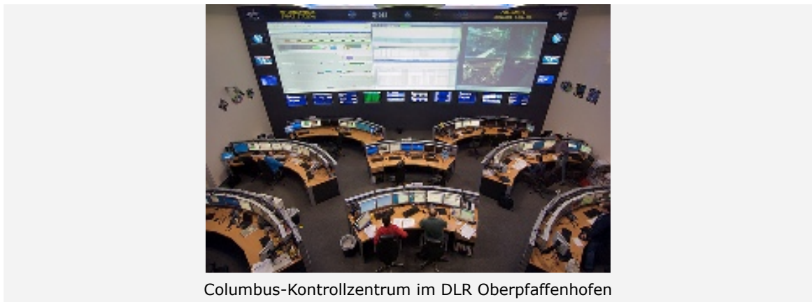
Columbus-Kontrollzentrum im DLR Oberpfaffenhofen

Herzlichen Glückwunsch, Columbus! Am 7. Februar 2008 startete das europäische Forschungsmodul im Space Shuttle Atlantis auf dem Flug STS-122 vom Kennedy Space Center in Florida. Columbus wurde am 11. Februar 2008 an die ISS montiert und in Betrieb genommen. Columbus - Europas Beitrag zur Internationalen Raumstation ISS - ist ein Mehrzwecklabor für die multidisziplinäre Langzeitforschung unter Schwerelosigkeit. Basis für die Entwicklung und Fertigung war das Raumstationsprogramm der Europäischen Weltraumbehörde ESA, welches national von der Raumfahrt-Agentur des Deutschen Zentrums für Luft- und Raumfahrt (DLR) betreut wurde und innerhalb dessen, im engen Schulterschluss mit der deutschen Industrie, der Bau von Columbus realisiert wurde. Der deutsche Industrieanteil am Bau von Columbus betrug dabei nahezu 50 Prozent.