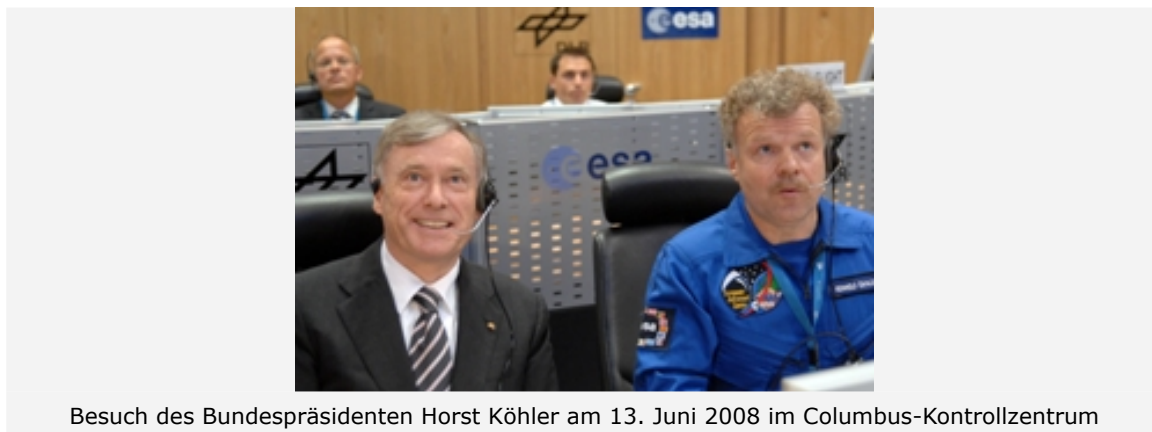
Besuch des Bundespräsidenten Horst Köhler am 13. Juni 2008 im Columbus-Kontrollzentrum

Mit einer geplanten Lebensspanne von mehr als zehn Jahren hat Columbus als erstes europäisches Weltraumlabor jetzt schon für die Langzeitforschung unter Weltraumbedingungen Geschichte geschrieben. Sofort nach dem Andocken wurde mit WAICO, einem Experiment zum Wachstum von Pflanzenwurzeln, das BIOLAB in Betrieb genommen. Weitere Experimente aus dem Bereich der Raumfahrtmedizin, der Strahlen- und Astrobiologie sowie der Fluidphysik folgten. Hierfür kamen die European Physiology Modules und das Fluid Science Lab in Columbus sowie Expose-EuTEF auf der Außenseite zum Einsatz. Mit rund 40 Prozent der europäischen Experimente spielen deutsche Wissenschaftler eine herausragende Rolle. Zahlreiche Projekte, die sich im internationalen Wettbewerb durchgesetzt haben, warten noch auf ihre Umsetzung in den nächsten Monaten. Forschung in Biologie, Raumfahrtmedizin, Materialwissenschaften und Fluidphysik wird hier zu neuen Erkenntnissen führen, die für den Menschen auf der Erde selbst sowie für die Entwicklung innovativer Technologien von Bedeutung sind. Sie unterstützen damit den Wissenschafts- und Wirtschaftsstandort Deutschland.