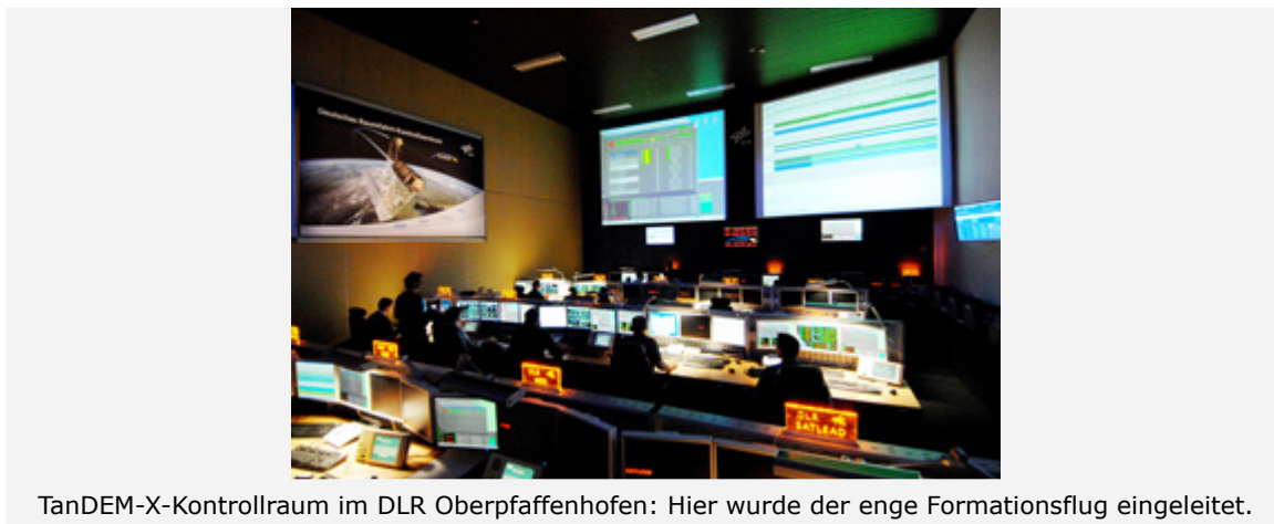
TanDEM-X-Kontrollraum im DLR Oberpfaffenhofen: Hier wurde der enge Formationsflug eingeleitet.

Der enge Formationsflug läutet den sogenannten "bi-statischen Betrieb" der TanDEM-X-Mission ein. Die beiden Radarsatelliten arbeiten nicht mehr unabhängig, sondern synchron. Dabei sendet ein Satellit die Radarimpulse für die Aufnahme und beide empfangen das am Boden reflektierte Signal. "Nur im bi-statischen Betrieb erhalten wir die für das globale Höhenmodell notwendige Bildqualität. Wir haben damit einen wichtigen Meilenstein der Mission erreicht", betont Zink. Die Antennen von TerraSAR-X und TanDEM-X ergänzen sich im engen Formationsflug wie ein Augenpaar. Nun wird die Kombination der beiden Radarbilder nicht mehr durch unruhige Flächen, wie zum Beispiel Wasser oder Wälder, beeinflusst und die gemeinsamen Daten lassen sich zu ungestörten Höhenmodellen verarbeiten.