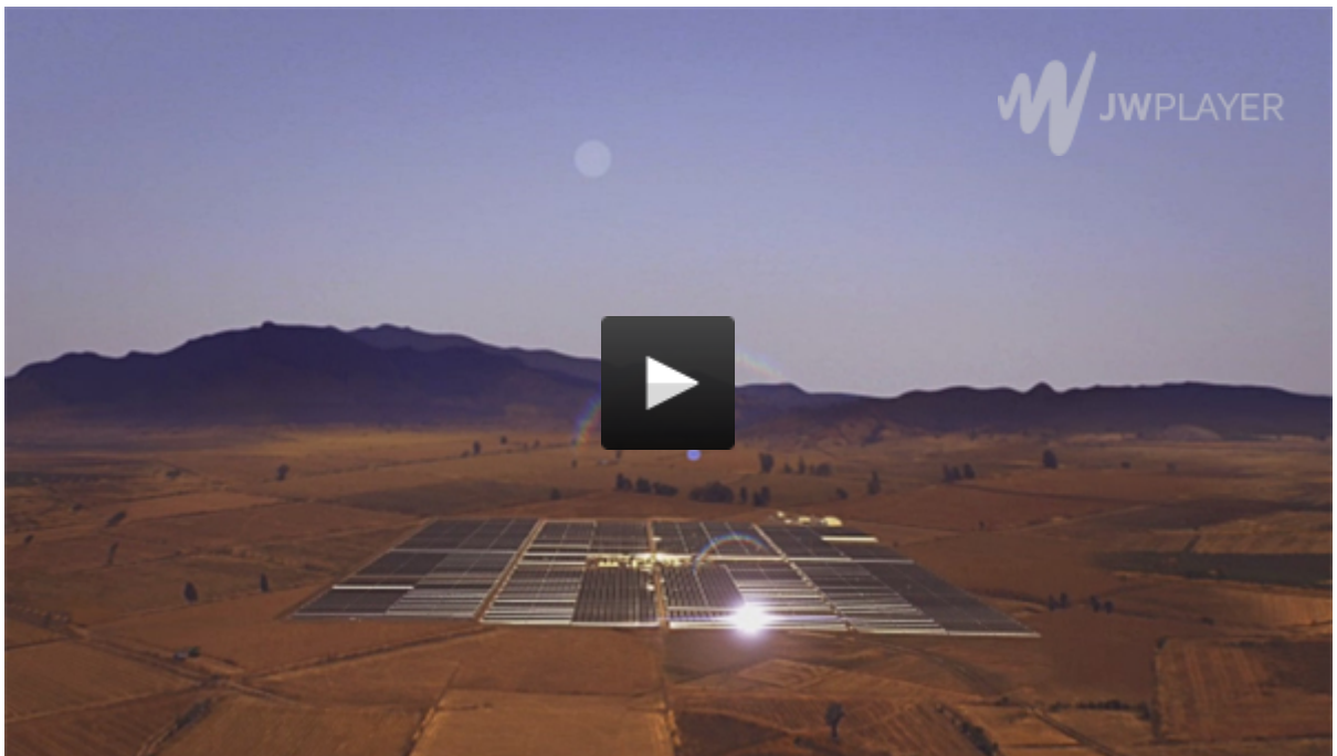
Video: Global atlas for Wind and Solar Energy (engl.)