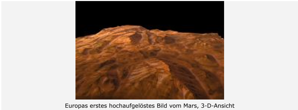
Europas erstes hochauflöses Bild vom Mars, 3-D-Ansicht

Das erste vom HRSC-Team veröffentlichte Bild wurde am 14. Januar 2004 vom Orbiter der Mission Mars Express der Europäischen Weltraumorganisation ESA aus einer Höhe von 275 Kilometer mit der deutschen Stereokamera aufgenommen. Es zeigt (oben links) einen kleinen Ausschnitt (54 Kilometer mal 26 Kilometer) aus einem 1.700 Kilometer langen und 65 Kilometer breiten Bildstreifen, der in Süd-Nord-Richtung über dem großen Mars-Canyon Valles Marineris aufgenommen wurde. Es ist die erste Aufnahme, welche die Marsoberfläche in hoher Auflösung (12 Meter pro Bildpunkt), in Farbe und dreidimensional zeigt.