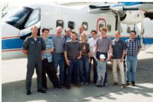
Die an der Kampagne beteiligten Wissenschaftler vor dem DLR-Forschungsflugzeug Dornier 228 auf dem Sonderflughafen in Oberpfaffenhofen

Der zuständige Leiter der ESA-Kampagne, Evert Attema, sieht "INDREX-2" als eine "exzellente Möglichkeit zur Weiterentwicklung von Raumfahrttechnologien". Das Experiment werde helfen, "auch in Zukunft die Lebensqualität auf unserem Planeten zu gewährleisten". Für den Weltraumeinsatz plant die ESA den Bau eines Radars mit längeren Wellenbereichen, die sozusagen durch die Baumkronen des Regenwaldes "hindurch sehen" können und so auch Aufschluss über die Höhe der Urwaldbäume geben. Bei einem Workshop in Jakarta im September 2005 werden die Ergebnisse von "INDREX-2" vorgestellt.