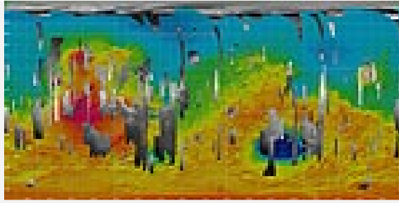
Mars: Von der HRSC-Kamera aufgenommene Gebiete

Nach diesem Prinzip lässt sich eine großflächige Kartierung der Marsoberfläche erreichen, in der nicht nur Details bis zu zehn Meter Größe festgehalten werden, sondern gleichzeitig auch die "dritte Dimension", also topographische Daten, Eingang finden. Zusätzlich zu den HRSC-Bildstreifen liefert ein in das Kamerasystem integriertes Teleskop, der "Super Resolution Channel" SRC, von ausgewählten kleinen Gebieten inmitten der HRSC-Aufnahmen quadratische Bilder in vierfach höherer Auflösung. Hauptaufgabe des HRSC-Experiments auf Mars Express ist es, den ganzen Planeten (dessen Fläche von 145 Millionen Quadratkilometer etwa der aller Kontinente der Erde entspricht) in hoher Auflösung, Farbe und 3-D zu erfassen. Dieses Ziel könnte mit einer - von der ESA bereits ins Auge gefassten - Verlängerung der Mission bis Ende 2007 erreicht werden. Zum gegenwärtigen Zeitpunkt hat die HRSC bereits über zwanzig Prozent des Mars in guter bis sehr guter Auflösung fotografiert.