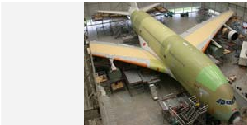
Der Airbus A380-800

Göttingen/Toulouse - Vor kurzem wurde mit dem so genannten Standschwingungsversuch am Megaliner A380 die zentrale Messkampagne vor dem Erstflug in Toulouse erfolgreich abgeschlossen. Spezialisten vom Institut für Aeroelastik des Deutschen Zentrums für Luft- und Raumfahrt (DLR) in Göttingen führten den Versuch in Kooperation mit Ingenieuren und Technikern der französischen ONERA (Office National des Études et des Recherches Aérospatiales) durch. Die erzielten Messergebnisse dienen als Basis für den aeroelastischen Zertifizierungsprozess und somit für die Zulassung des größten, modernsten und auch beeindruckendsten zivilen Flugzeugs der Welt.