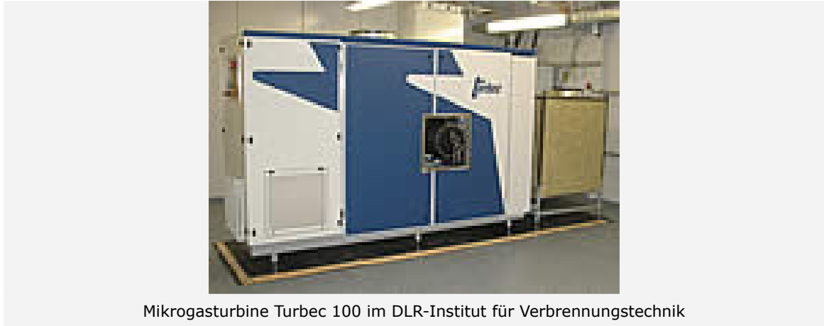
Mikrogasturbine Turbec 100 im DLR-Institut für Verbrennungstechnik

Im weiteren Verlauf der Zusammenarbeit planen die Wissenschaftler die reale Kopplung des Kraftwerkaufbaus auf dem Areal des DLR in Stuttgart. Fernziel ist ein Demonstrationskraftwerk im Megawattbereich an einem geeigneten Standort unter der Betriebsleitung des Energieversorgers. Aufbauen können die Wissenschaftler für ihre Entwicklungsarbeiten auf ersten Erfahrungen von Siemens-Westinghouse im Betrieb eines Hybrid-Kraftwerks.