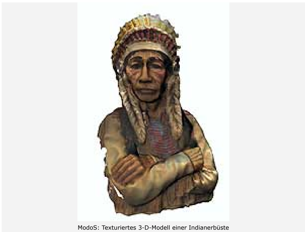
ModoS: Texturiertes 3-D-Modell einer Indianerbüste

Köln/Hannover – Mit einer Reihe zukunftsreicher High-Tech-Exponate beteiligt sich das Deutsche Zentrum für Luft- und Raumfahrt (DLR) an der diesjährigen Hannover Messe vom 24. bis 28. April 2006. Das DLR-Technologiemarketing präsentiert im Zeichen der Initiative "Sachen machen!" marktreife Technologien auf dem Gemeinschaftsstand des VDI (Halle 2, Stand D36).