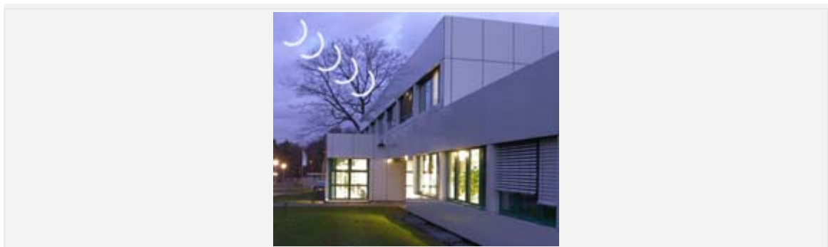
Das Nutzerzentrum für Weltraumexperimente (MUSC) des DLR in Köln-Porz: Kontrollraum für den Rosetta-Lander Philae.

Der "Virtuelle Kontrollraum" ist bereits seit Ende 2005 online. Bis jetzt konnte man dort aktuelle Daten direkt aus den Kontrollräumen des Nutzerzentrums für Weltraumexperimente (MUSC) des Deutschen Zentrums für Luft- und Raumfahrt (DLR) zu den Missionen Rosetta und Mars Exploration Rover live verfolgen. Nun ist ein dritter "Kontrollraum" hinzugekommen: Die Benutzer können die aktuellen Messdaten des MATROSHKA-Experiments auf der ISS abrufen, das die Strahlenbelastung innerhalb und außerhalb der Internationalen Raumstation ISS misst.