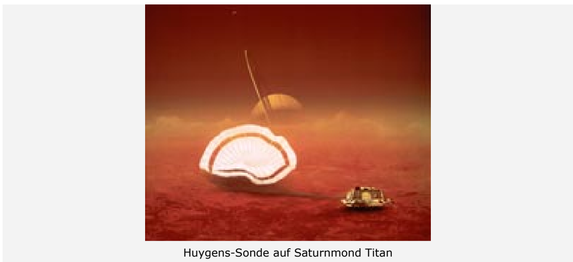
Huygens-Sonde auf Saturnmond Titan