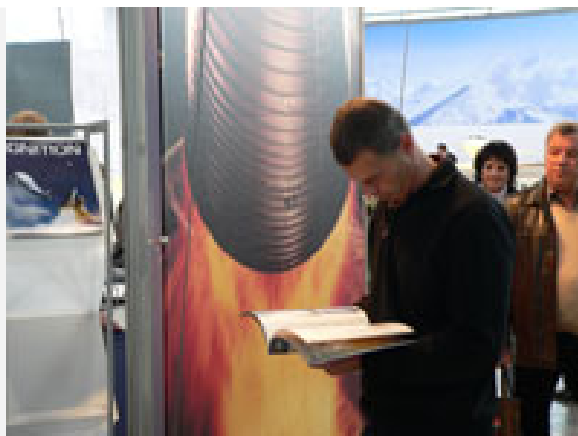
Leseinsel mit DLR-Magazin.

Angesichts des freien Eintritts für die Besucher waren die Aussteller allerdings auf den großen Publikumsandrang eingestellt. Mit Produktvorführungen und Prominententalk, Mitmachaktionen und Riesenrad, Showbühne und leckeren Speisen lockten die Aussteller zu den Ständen und mit Fotoapparat und Windrädchen, prall gefüllten Prospekttaschen und Gummibärchen, Luftballons und Tombolapreisen schlenderten die Besucher neugierig und bestens gelaunt durch das auch architektonisch bemerkenswert gestaltete Areal.