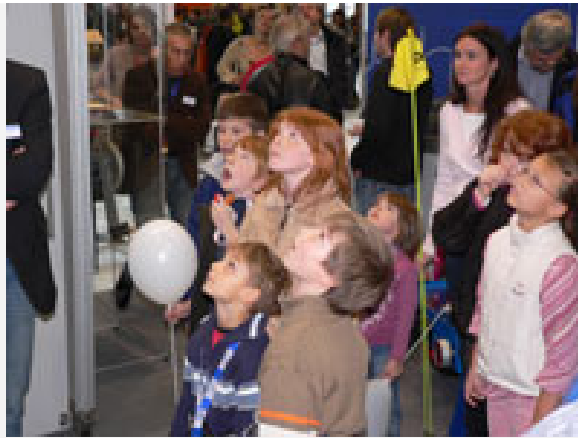
Die Luftdruckrakete hebt ab.