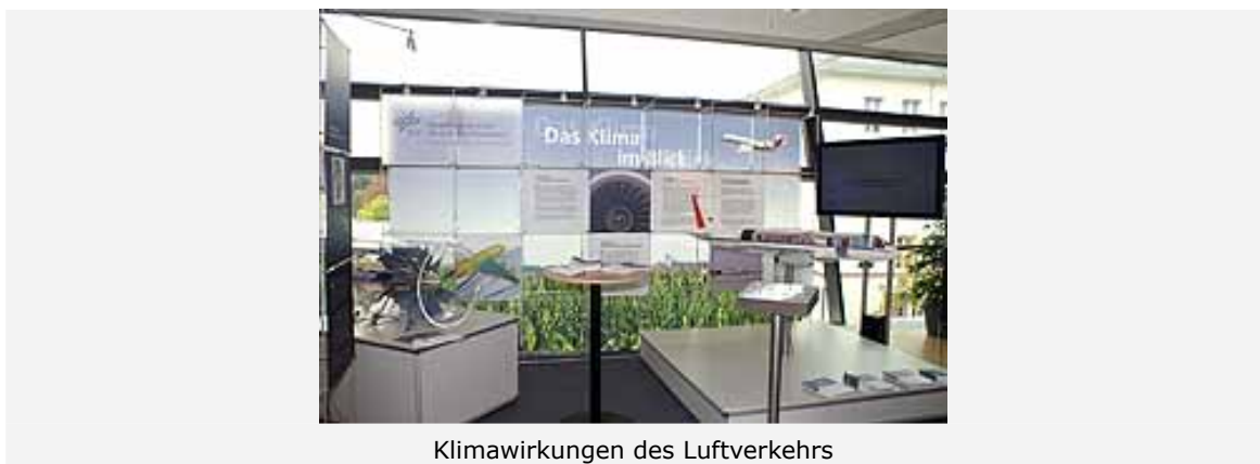
Klimawirkungen des Luftverkehrs