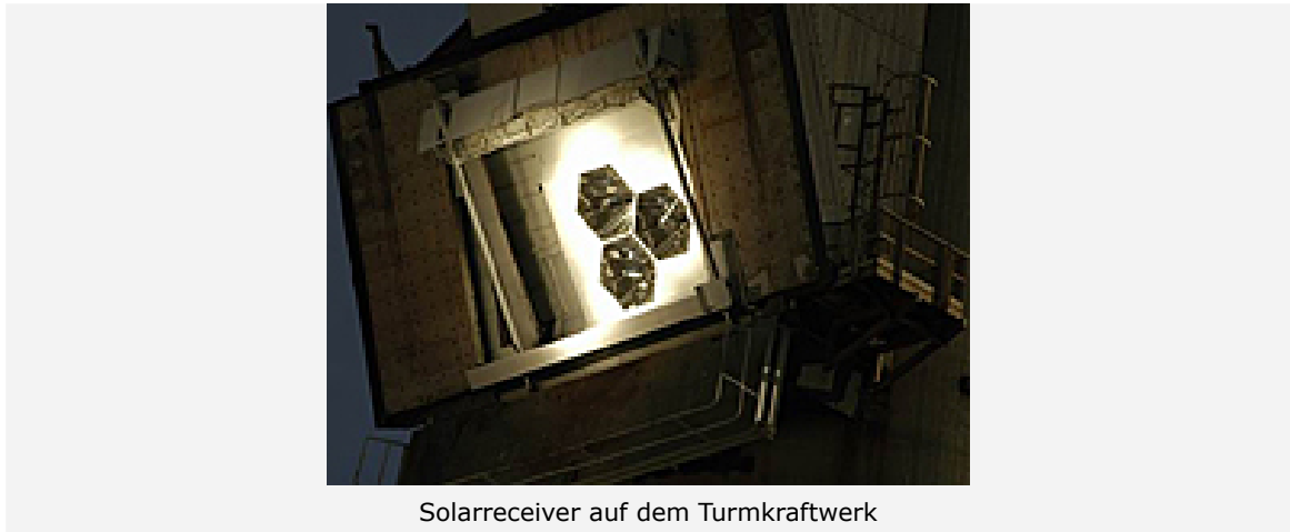
Solarreceiver auf dem Turmkraftwerk

Ziel des Projekts HYDROSOL ist es, mit Sonnenenergie Wasserstoff aus Wasser zu gewinnen. Dies geschieht in einer zweistufigen chemischen Reaktion, die in mit Eisenmischoxid beschichteten keramischen Wabenkörpern stattfindet. Beim DLR konnte mit dem HYDROSOL-Prozess zum ersten Mal ein solarthermochemischer Kreis-Prozess vollständig geschlossen und Wasserstoff quasi-kontinuierlich produziert werden. Eine 100 Kilowatt-Pilotanlage wurde in Almería in Südspanien aufgebaut und getestet.