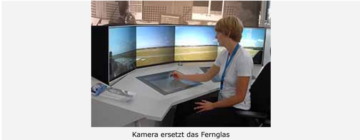
Kamera ersetzt das Fernglas

Tragflächen gleichmäßig (laminar) umströmt. Das Strömungsverhalten verbessert sich damit um bis zu 20 Prozent. Folglich wird weniger Treibstoff benötigt, damit werden auch weniger Emissionen verursacht.