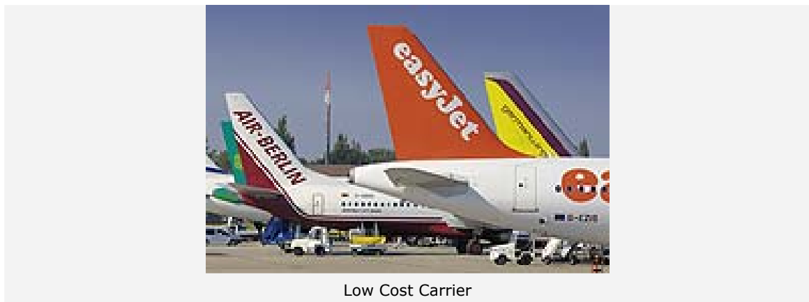
Low Cost Carrier

Der weltweite Luftverkehr verzeichnet einen starken Einbruch, der mindestens noch bis Ende Juni 2009 anhalten wird. Dieser Rückgang wird insbesondere in Nordamerika und Europa stattfinden. Der Luftverkehr im Nahen Osten hingegen wird sich weiterhin positiv entwickeln. In Deutschland wird für den Zeitraum April bis Juni 2009 mit einem Rückgang von deutlich mehr als fünf Prozent gerechnet. Dies sind Kernaussagen des "Global Aviation Monitors (GAM)", der vom Deutschen Zentrum für Luft- und Raumfahrt (DLR) erstmals erstellt worden ist.