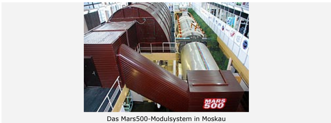
Das Mars500-Modulsystem in Moskau