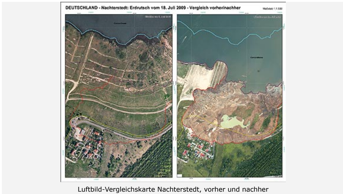
Luftbild-Vergleichskarte Nachterstedt, vorher und nachher