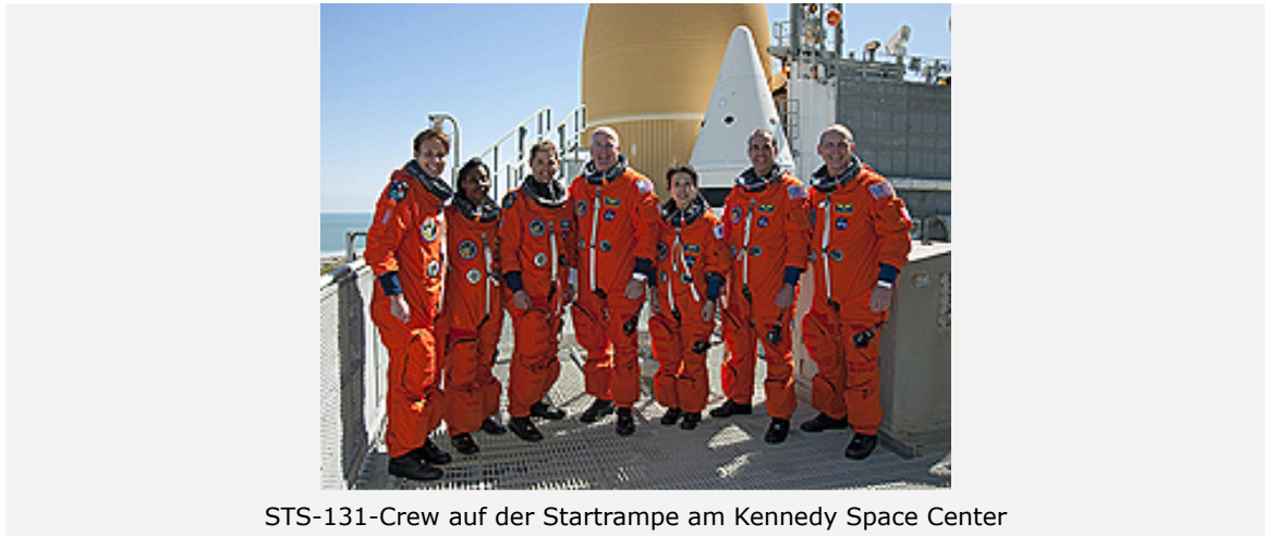
STS-131-Crew auf der Startrampe am Kennedy Space Center

Das DLR-Raumfahrt-Management förderte die wissenschaftlichen Arbeiten des ZARM sowie die Entwicklung und den Bau der Forschungsapparatur CCF durch die deutsche und europäische Raumfahrtindustrie (Astrium) mit Geldern des Bundesministeriums für Wirtschaft und Technologie. Die NASA ist im Wesentlichen für den Transport der Apparatur zur ISS, deren dortigen Betrieb und das Astronautentraining verantwortlich. Die deutsche Seite stellt die Apparatur für den Bordeinsatz sowie ein Ingenieur- und ein Trainingsmodell zur Verfügung. Das Flugmodell wird in der "Microgravity Science Glovebox" (MSG) der NASA im Columbus-Modul der ISS installiert.