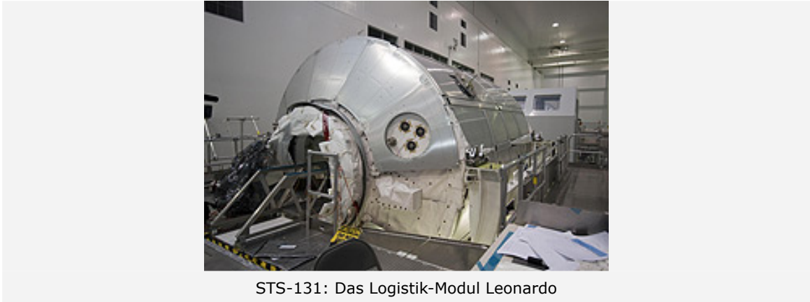
STS-131: Das Logistik-Modul Leonardo

Die Mission STS-131 bringt mit dem Mehrzweck-Logistik-Modul "Leonardo" Ausrüstungsgegenständen und wissenschaftliches Material zur ISS. Das Modul befördert beispielsweise das letzte von vier Schlafquartieren für die Crew und wissenschaftliche Racks für die Labore an Bord der ISS, darunter einen zweiten Schmelzofen für das materialwissenschaftliche Labor MSL ( M aterials S cience L aboratory).