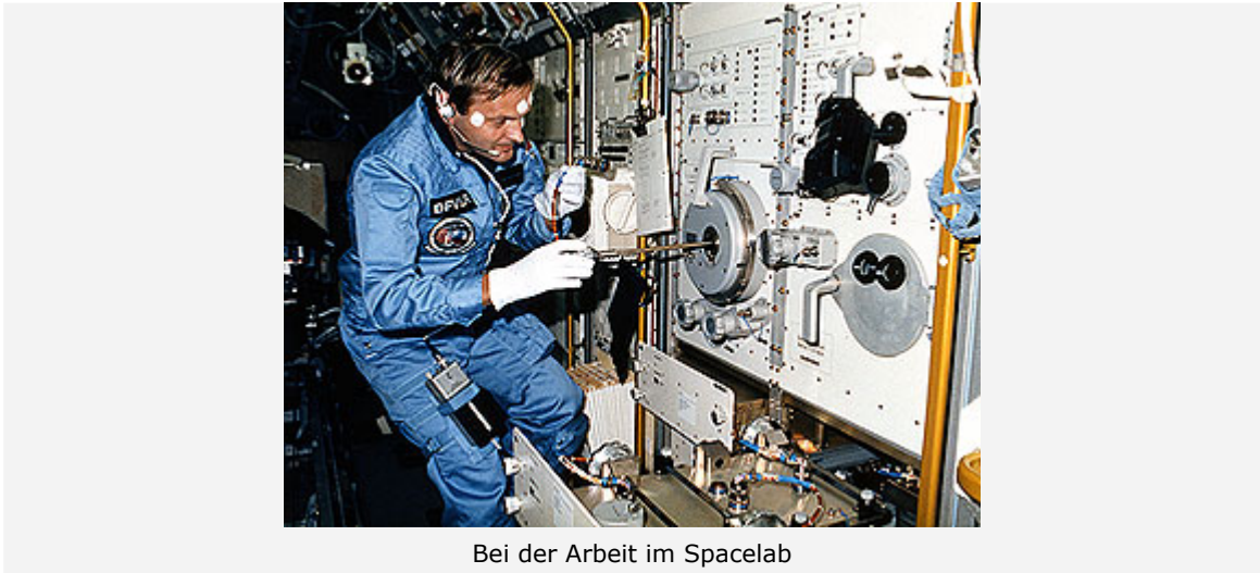
Bei der Arbeit im Spacelab

Direkt zu Beginn des ersten Arbeitstages schwebte ich ins Spacelab und sah viele rote und gelbe Leuchtdioden - das waren Experimente, die nicht funktionierten. Dann hatten wir ein Problem mit einem Vakuumleck. Wir mussten in den Öfen an Bord des Spacelabs ein Vakuum erzeugen und dazu stellt man eine Verbindung mit dem Weltall her. Allerdings war eine undichte Stelle in dieser Leitung, und vom Boden teilte man uns mit: Wenn ihr das Leck nicht findet, ist die Mission nach zwei Tagen vorbei, weil euch die Luft ausgeht. Dann gab es noch MEDEA, ein sehr teures Materialforschungsinstrument, das nicht in Betrieb genommen werden konnte. Da mussten wir aus einem Kabelsalat das richtige Kabel aussuchen, das wir durchzuschneiden hatten. Es klappte, aber am letzten Tag ging auf einmal die Tür zum Behälter nicht mehr auf. Da habe ich - schließlich gelernter Klempner und Installateur - dann mit ein paar Mikroschraubenziehern und einem Inbus-Schlüssel das Schloss zerlegt. Das zeigt vor allem, dass es wichtig ist, bei den Experimenten vor Ort Astronauten zu haben, die experimentelle Erfahrung haben und eingreifen können.