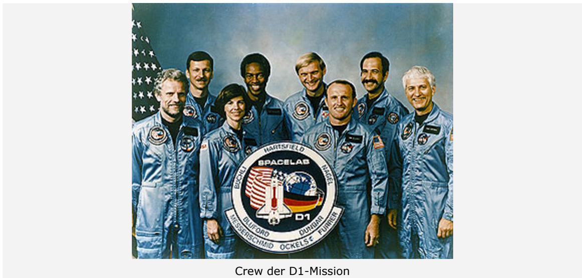
Crew der D1-Mission

Astronaut ist nicht der gängige Beruf für solche Dinge.