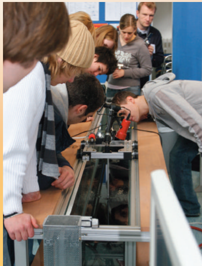
Praxisteil: Gestauchte und gestreckte Wellenmuster auf der Wasseroberfläche faszinieren die Schüler