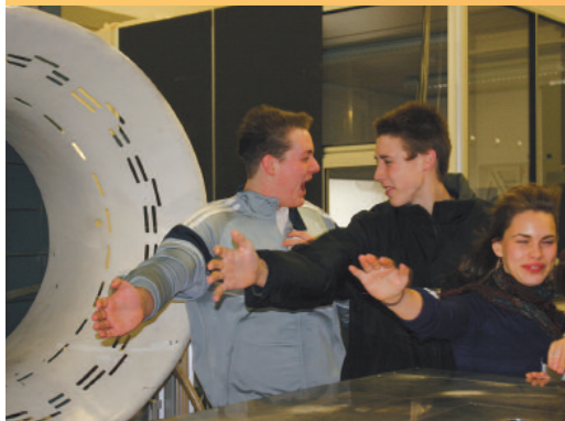
Im DLR_School_Lab begreifen Schüler Forschung mit allen Sinnen