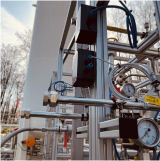
Wasserstoff-Testinfrastruktur (gasförmig und flüssig)