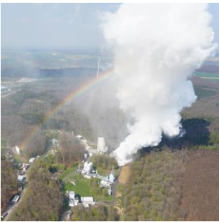
Teststände für Raumfahrtantriebe