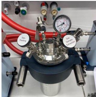
Reinheitsuntersuchungen von Wasserstoff