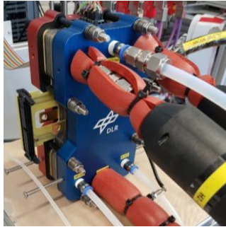
Brennstoffzellen- und Elektrolysetests