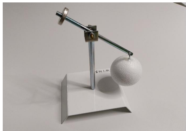
Auftriebswaage im DLR_School_Lab Hochschule Zittau/Görlitz.

Ein zweiter Effekt, den man vor allem bei etwas wärmeren Wasser beobachten kann, ist die Erniedrigung des Siedepunkts des Wassers. Wasser siedet unter Normaldruck (auf der Höhe des Meeresspiegels) bei 100 Grad Celsius. Steigt man in die Berge, sinkt der Luftdruck und Wasser siedet bereits bei tieferen Temperaturen. Dieser Effekt lässt sich unter einer Vakuumglocke wesentlich verstärken, sodass das Wasser bereits bei Raumtemperatur zu sieden beginnt. Durch Verwendung von Wassergefäßen mit unterschiedlichen Temperaturen lässt sich weiterhin zeigen, dass Wasser mit geringerer Temperatur geringere Druckwerte zum Sieden benötigt als Wasser mit