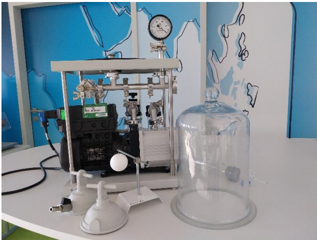
Vakuumversuchstand im DLR_School_Lab Hochschule Zittau/Görlitz.

Die Kraft des Luftdrucks: Auf jedem Quadratmeter der Erdoberfläche lastet eine Luftsäule von etwas mehr als 10 Tonnen. Dieses gewaltige Gewicht lässt sich am besten im Versuch mit den Magdeburger Halbkugeln demonstrieren. Die beiden Halbkugeln werden in diesem Versuch scheinbar durch das Vakuum im Inneren der von ihnen gebildeten Kugel zusammengehalten. In Wirklichkeit kann ein Vakuum (die Abwesenheit von Luft) natürlich nichts zusammenhalten, sondern es ist das Gewicht der auf den Halbkugeln lastenden Luft, das ein Trennen der Halbkugeln unmöglich macht.