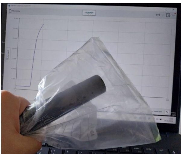
Messung von CO 2 im Atem.

1.) Kohlenstoffdioxid wirkt für den Menschen stark giftig. Bereits ab einem Gehalt von 8% in der Luft kommt es zur Atemlähmung und damit zum Tod. Auch bei geringeren Gehalten kann Kohlenstoffdioxid zu Ohnmachtsanfällen führen. Diese Wirkung ist für den Menschen besonders gefährlich, weil die Menschen das farb- und geruchlose Kohlenstoffdioxid nicht wahrnehmen und weil sich das Gas aufgrund seiner großen Dichte im Vergleich zu Luft in Kellern, Höhlen und ähnlichem ansammeln kann. Des Weiteren kann Kohlenstoffdioxid in