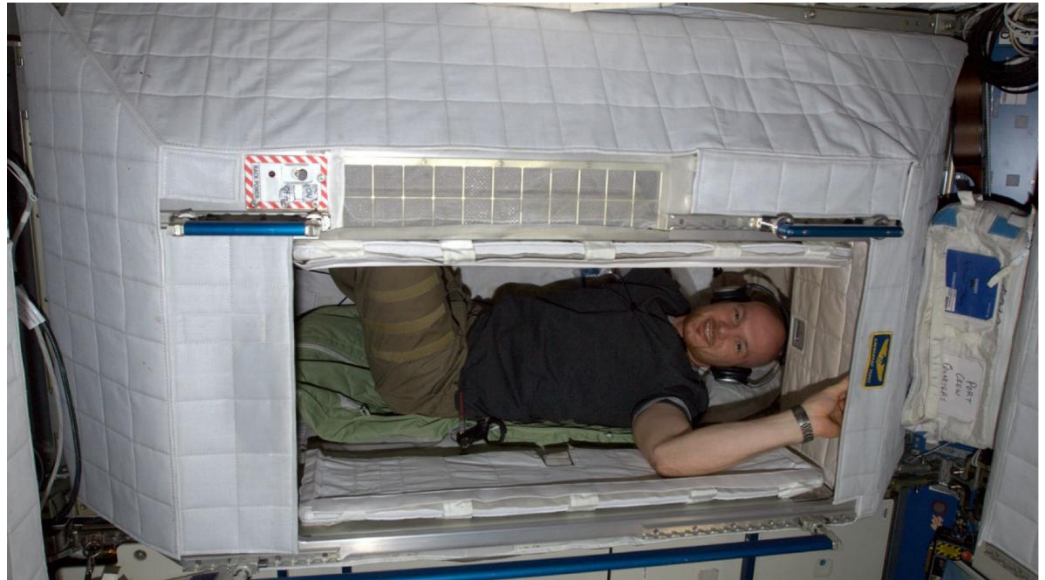
Die Schlafkabine von Alexander Gerst auf der Internationalen Raumstation ISS

In Zeitlupe können die Schülerinnen und Schüler deutlich erkennen, wie die Flamme sich halbkreisförmig zurückbildet, um schließlich ganz auszugehen. Die Erklärung: Unter normalen Schwerkraftbedingungen steigt warme Luft nach oben und zieht frische Luft hinter sich her. Das nennt man Konvektion – sie versorgt die Kerzenflamme immer mit sauerstoffreicher Luft. In Schwerelosigkeit dagegen können die warmen Verbrennungsgase nicht nach oben steigen, und von unten strömt nicht genug frischer Sauerstoff nach. Daher sammelt sich die sauerstoffarme Luft um die Kerze und die Flamme erstickt. Deshalb muss auf der ISS immer ein leichtes Lüftchen wehen, damit die Crewmitglieder jederzeit frische Luft bekommen. Im Mini-Fallturm warten auch noch andere spannende Experimente rund um die Schwerelosigkeit! Voll abgehoben – garantiert!