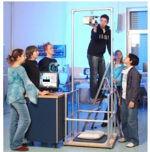
Schülerinnen und Schüler experimentieren am Mini-Fallturm

In einer Fallkapsel installieren wir eine Zeitlupenvideokamera, die per Funk ihre Bilder an einen Computer sendet. Die Kapsel wird oben am Mini-Fallturm