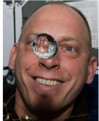
Eine Wasserkugel auf der ISS

Solche Anwendungen der Schwerelosigkeit helfen heute dabei, modernste Metalllegierungen herzustellen. Oder Verbrennungsvorgänge in Motoren zu optimieren. Sie zeigen aber auch, was Techniker auf der Erde beachten müssen, damit Astronautinnen und Astronauten im All überhaupt etwas trinken können. Oder damit der Raketentreibstoff in die richtige Richtung fließt. Während der Schlafphase auf der ISS muss eine permanente Ventilation an Bord sichergestellt sein – sonst sammelte sich in der Schwerelosigkeit das ausgeatmete Kohlendioxid um die Köpfe der Astronautinnen und Astronauten und sie könnten ersticken. Warum ist das so? Und wie können wir solche Schwerelosigkeitseffekte im Experiment überprüfen?