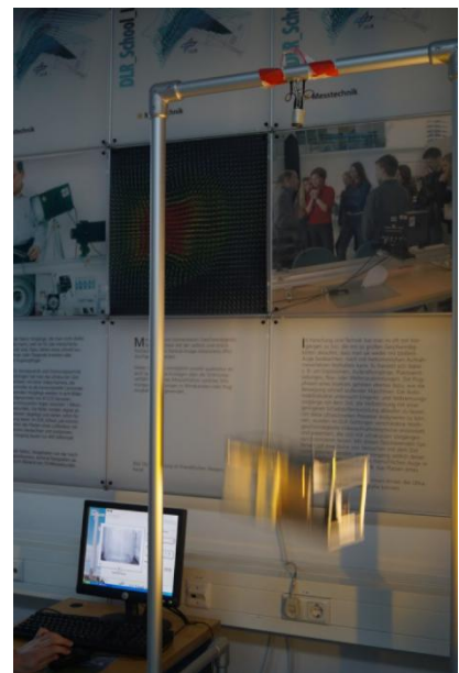
Der Mini-Fallturm in Aktion