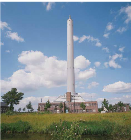
Der Fallturm in Bremen

Das geht mit Parabelflügen – und in Falltürmen. Der größte der Welt steht in Bremen, ist 150 Meter hoch und ermöglicht freien Fall für bis zu neun Sekunden. Bei Parabelflügen fliegt ein spezielles Flugzeug auf einer sogenannten Parabelbahn; dabei geht es rauf und runter wie in einer Achterbahn. Nach etwa 20