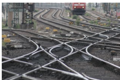
Bedarfsgerechte Instandhaltung für wartungsintensive Infrastrukturelemente

ETCS set up common standards for the rail traffic in Europe