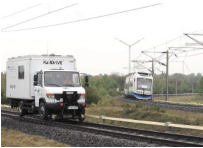
Versuchs- und Messfahrzeug RailDrive®