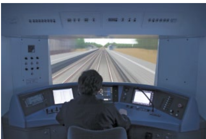
Interaktive Systeme im Bahnlabor RailSiTe®

Eine optimal an die menschlichen Fähigkeiten angepasste Mensch-Maschine-Schnittstelle beugt Fehlbedienungen und daraus entstehenden Kosten vor. Das DLR unterstützt Hersteller und Betreiber bei der Entwicklung gebrauchstauglicher interaktiver Systeme und der Überprüfung der Usability von bereits existierenden Systemen im Bahnbereich. Gestaltungsempfehlungen werden abgeleitet und prototypisch umgesetzt und validiert.