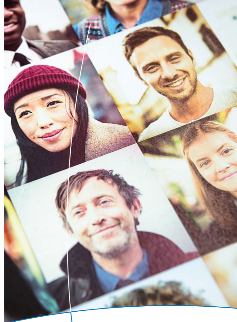
Vielfalt, die Wissen schafft_L_D_07/2017